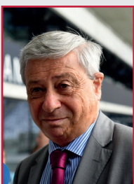
Etienne GUYOT Préfet de la Région Nouvelle-Aquitaine

Dans un dialogue constant et de confiance avec les acteurs et les territoires néo-aquitains, le CPER a vocation en investissant à soutenir les projets à fort rayonnement régional, dont la réalisation s'étend jusqu'à 2027.