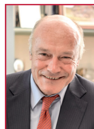
Alain ROUSSET Président du Conseil régional de Nouvelle-Aquitaine

« Les CPER fêterons en 2024 leur 40 e année d'existence. Ils ont, au cours des 6 générations écoulées, fait la preuve de leur utilité en faisant converger les politiques publiques, pour accompagner au plan de l'investissement, le développement des territoires, sur le champ de l'enseignement supérieur et la recherche, les mobilités ou encore la cohésion sociale. Je suis heureux aujourd'hui de signer aux côtés du président du Conseil régional ce 7 e contrat, le premier sur le périmètre de la Nouvelle-Aquitaine, pour apporter aux habitants de cette grande région des réponses concrètes aux préoccupations de la société, notamment sur les questions de transition écologique et énergétique, d'équipements, d'aménagement et de cohésion des territoires. »